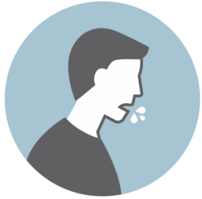
Gotículas de Saliva

A transmissão do coronavírus ocorre através de contato próximo com pessoas infectadas.