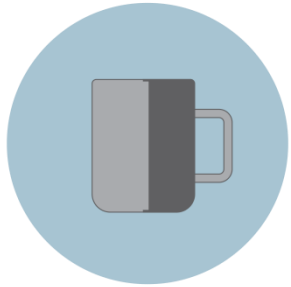
Contato com Objetos